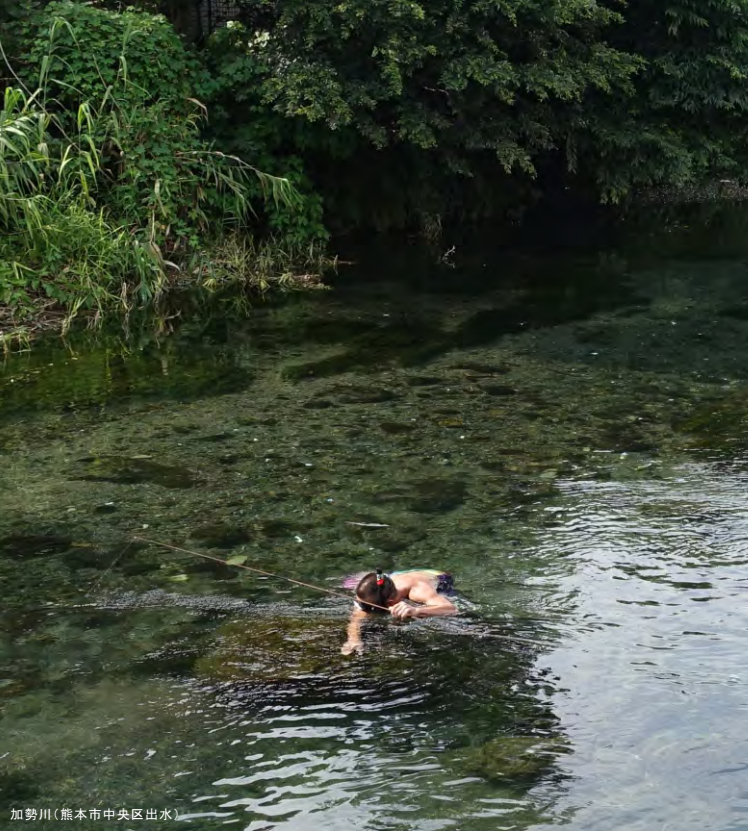
加勢川(熊本市中央区出水)